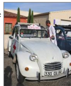
Le service de soins !