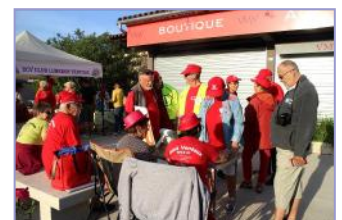
« Et bla bla bla... Et bla bla bla »... On sait faire aussi !