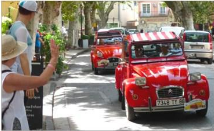
Les 2 CV ont traversé le village dans un grand concert de klaxons.

Les amateurs de la mythique 2 CV se sont retrouvés samedi matin dès 9 heures, sur le parking de la cave coopérative des Vignerons du mont Ventoux (VMV). Ils sont venus pour participer à la 25 e édition de la montée du Ventoux.