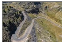
On a marché sur le toit du monde : panorama à 360°