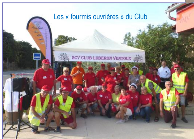
Les « fourmis ouvrières » du Club