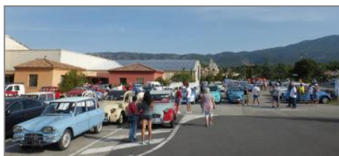
Le placement des véhicules sur le parking