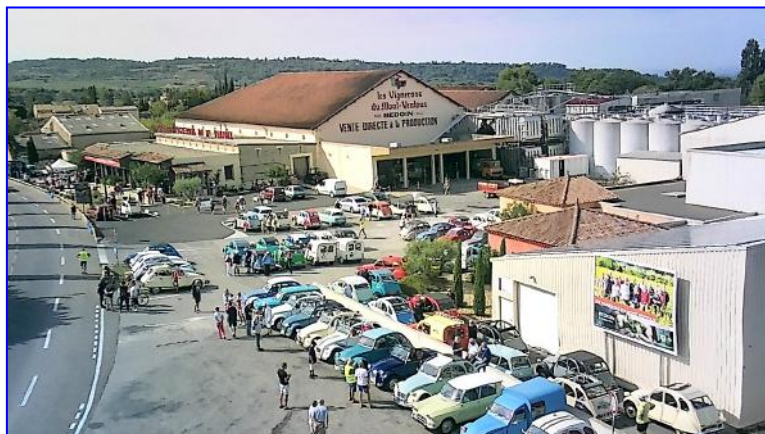
RdV - parking de la cave coopérative de Bédoin - VMV prise de vue Clément J.