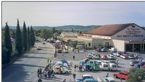
Rassemblement à la cave coopérative de Bédoin