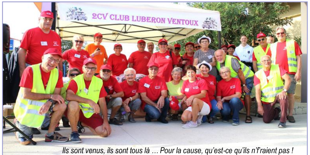
Ils sont venus, ils sont tous là ... Pour la cause, qu'est-ce qu'ils n'font pas !

Tout était prêt ce samedi 14 septembre 2019 pour accueillir nos deuchistes et autres adeptes de « bicylindres Citroën ». Un samedi incroyable : pas moins de 100 voitures dont 8 « Burton ». Des participants venus de Belgique, de Suisse, de Lorraine, de Charente maritime, de ... Il en arrivait de partout ! Les bénévoles, chargés de la surveillance et du placement des véhicules, ne ménageaient pas leur temps. Les vendanges venaient de commencer et nous ne devions en aucune façon perturber les allers et venues des tracteurs.